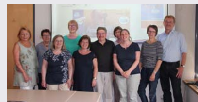
Fairtrade-Steuerungsgruppe des Landkreis Fürth