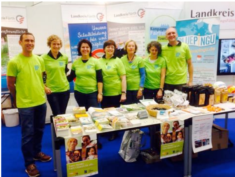
Die Initiative Faire Metropolregion Nürnberg

Hinweis: Mittagessen sowie Kaffee und Kuchen im "Zeitlos" sind bei den 5,00 € Teilnahmebeitrag diesmal nicht mit einberechnet! Das geht diesmal, je nach Bestellwunsch und Hunger (ob Vor- oder Hauptspeise, Suppe, Nachtisch, Nachmittagskaffee oder Kuchen) gesondert nach Karte.