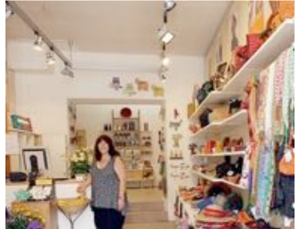
Blick in den neuen LoLa

Die Straße der Menschenrechte in Nürnberg ist eine Station der Fairkauf-Rundgänge