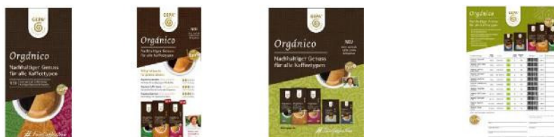
Bestellbogen Orgánico, PDF im Infoshop